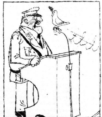
'Interpretatie' haalde het !!